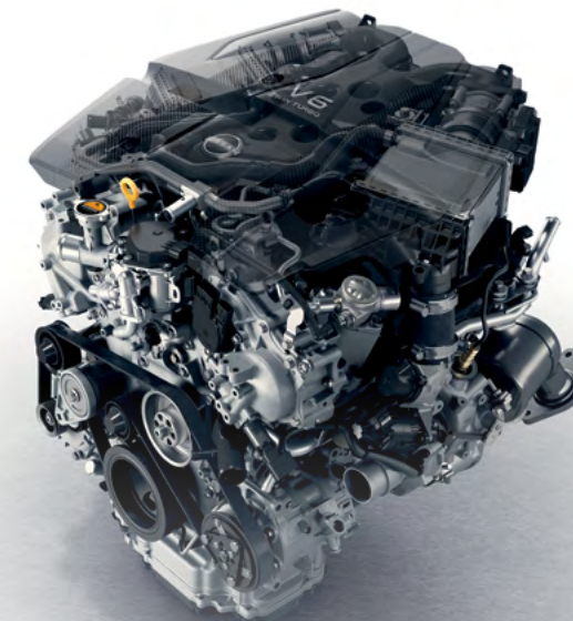
Motor V6 Twin-Turbo de 3.0 litros, 400hp y 350 Lb-pie de torque

Nissan Z cuenta con nuevos amortiguadores monotubo, una nueva geometría delantera, Frenos Akebono (R) de 4 pistones y puesta a punto de la suspensión trasera pensados para ofrecer una experiencia de manejo sobresaliente. La dirección asistida eléctrica permite mejor maniobrabilidad para un control y una precisión excepcionales.