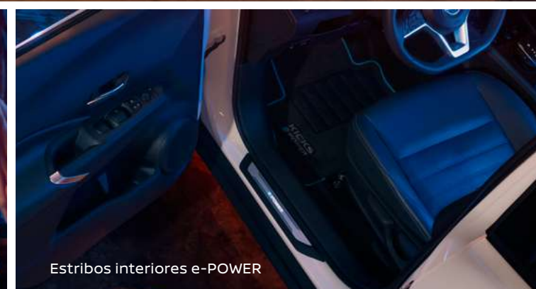
Estribos interiores e-POWER

Imágenes de referencia. *Los accesorios mostrados pueden venderse por separado. Consulta la ficha técnica para conocer el detalle de especificaciones. Consulta nivel de equipamiento y disponibilidad por versión y zona geográfica con tu Distribuidor Autorizado Nissan o visítanos en Nissan.com.mx