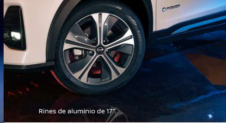
Rines de aluminio de 17".

El diseño exterior de Nissan Kicks Play e-POWER sumará un toque vanguardista y audaz a tu estilo. Enamórate del todo y también de sus detalles: rines de aluminio de 17", emblema exclusivo e-POWER y alerón trasero que le da un toque sofisticado y deportivo al vehículo.