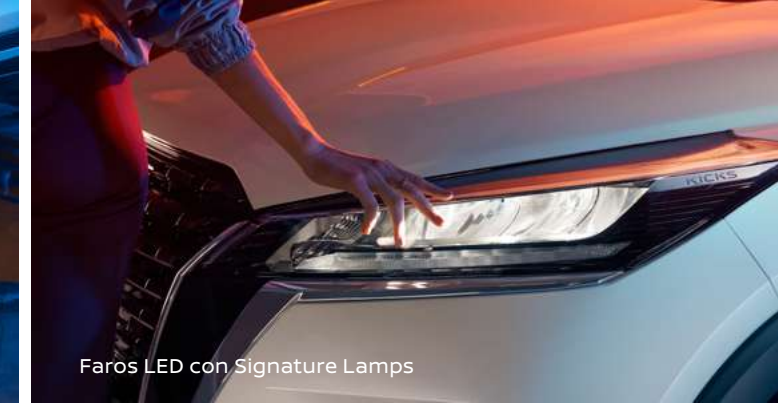
Faros LED con Signature Lamps