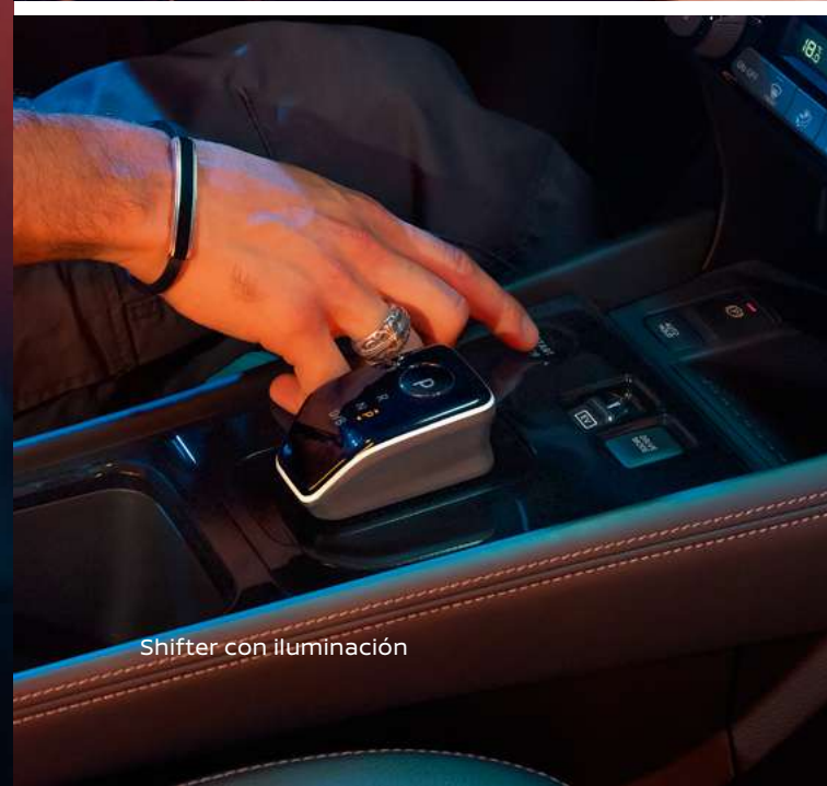
Shifter con iluminación