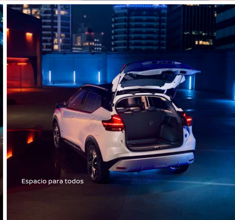
Espacio para todos