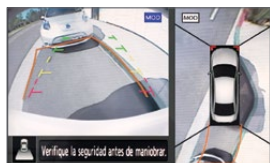
Vista trasera y cenital

Conéctate con tu auto como nunca habías podido, con las tecnologías de Nissan Intelligent Mobility. Nissan Altima® te permite controlar todo a tu alrededor mientras disfrutas la emoción de estar atrás del volante y sentir la confianza de tener una ayuda extra cuando tu conducción la requiera.