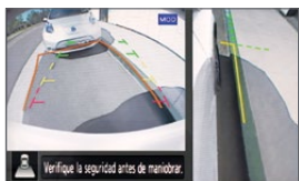
Vista trasera y lateral