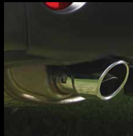
Terminal de escape cromada.

La gama de accesorios originales para Nissan X-Trail acentúa la versatilidad que lo distingue y permite disfrutar al máximo cada camino que se presente de una forma totalmente personal.