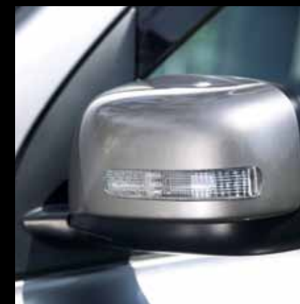
Cubiertas de espejos laterales con luz direccional integrada.