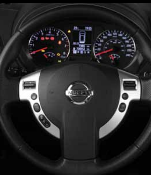
Controles de audio y velocidad crucero al volante.

Como prueba de lo anterior sobresale el conjunto de asientos forrados en piel, asientos delanteros con calefacción y el del conductor con soporte lumbar; así como controles de audio y de velocidad crucero montados al volante, cristales eléctricos, cámara de visión trasera ubicada en el espejo retrovisor y sistema de llave inteligente con función de apertura y cierre de puertas.*