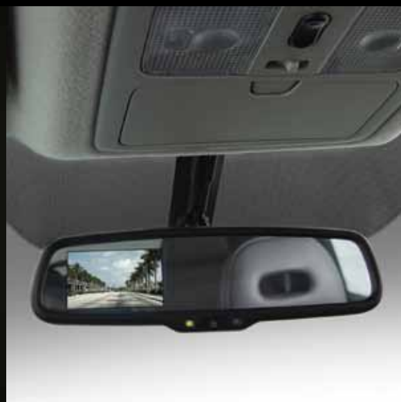
Cámara de visión trasera en espejo retrovisor.